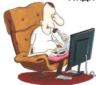
Действительно не заботится